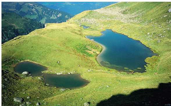
Der Berglimattsee liegt auf einem Plateau.

Der Berglimattsee liegt im Freiberg Kärpf auf einem Plateau, das im Übergang vom Stausee Garichti via Berglialp nach Matt liegt. Diese für einen See eher ungewöhnliche Lage und der fantastische Ausblick machen den Berglimattsee als Ausflugsziel besonders interessant. Der Kleinsee hat keinen sichtbaren Zu- und Abfluss. Neben Regen- und Schmelzwasser wird er vermutlich auch durch unterirdische Zuflüsse gespeist. Die maximale Wassertiefe beträgt nicht einmal zwei Meter.