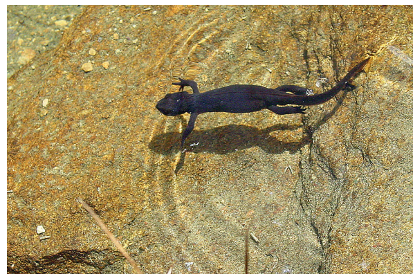
Bergmolche bewohnen den Berglimattsee.

Der Bergmolch ist der auffälligste Bewohner des Berglimattsees. Seine orange Bauchseite unterscheidet ihn deutlich vom einheitlich schwarzen, landbewohnenden Alpensalamander. Dieser ist in der Umgebung des Berglimattsees ebenfalls recht häufig anzutreffen. Von spezieller Schönheit sind die Bergmolch-Männchen im Hochzeitskleid mit ihrer bunten Färbung und dem niedrigen Rückenkamm.