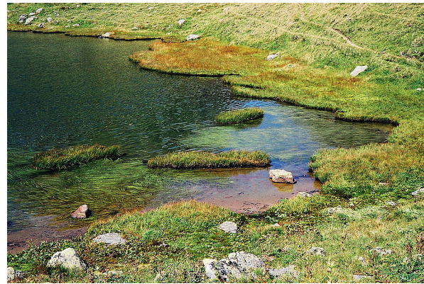
Am Ufer wachsen feuchteliebende Pflanzen.

Erst unter dem Mikroskop erkennt man die grosse Formenvielfalt der Kleinlebewesen im Berglimattsee. Teilweise leben diese tierischen und pflanzlichen